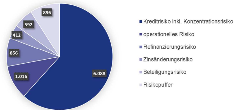
Gone Concern - Sichtweise (Werte in TEUR)